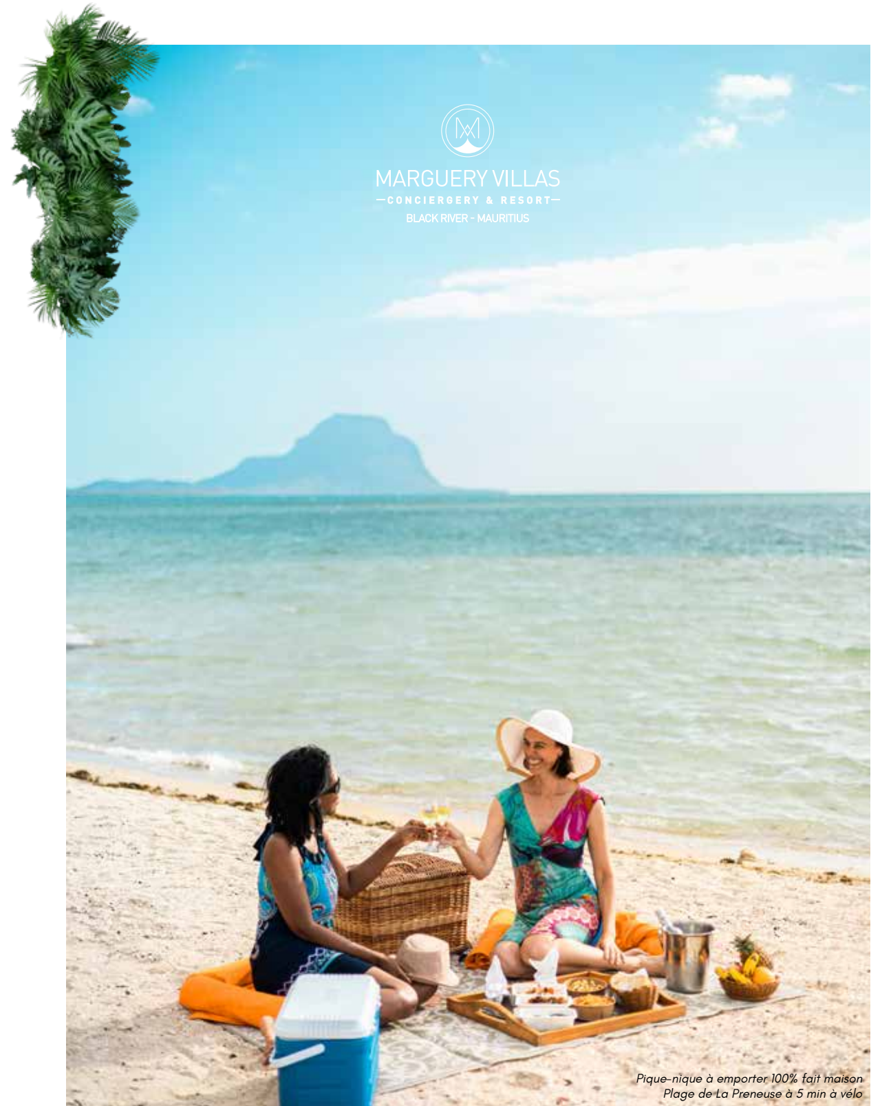
Pique-nique à emporter 100% fait maison Plage de La Preneuse à 5 min à vélo

"Nous vous promettons bien plus qu'un simple séjour : nous vous promettons une connexion authentique avec la culture, les saveurs et les couleurs uniques de ce paradis tropical."